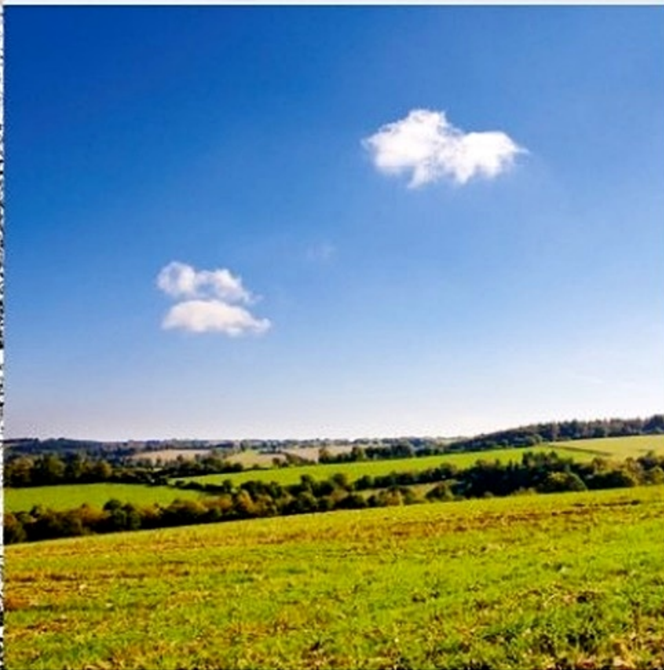
Authentique ; orteils et bois. Bretagne ; simplicité iodée. Urbain ; épure graphique. Nuages ; coton flottant sur le paysage.