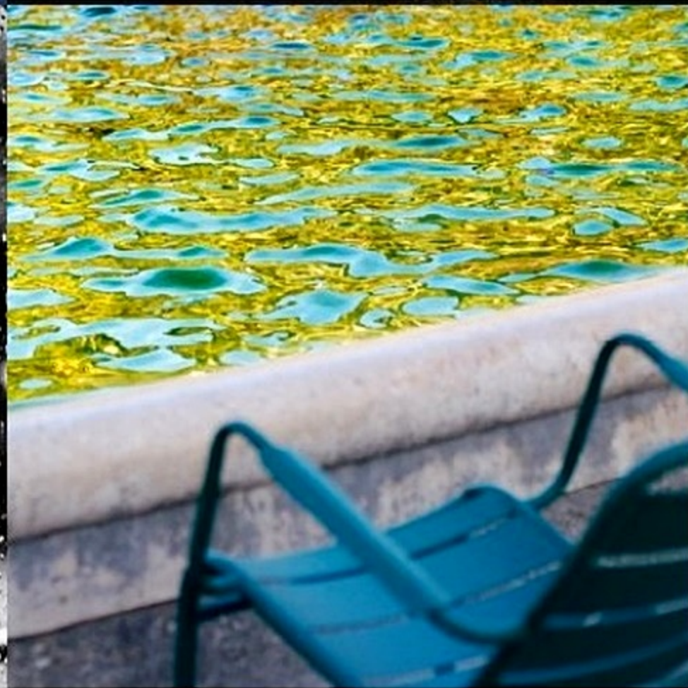
Flous les visages, les gens, le jardin, l'assise ! Laissons parler le décor, les créatures, les textures...