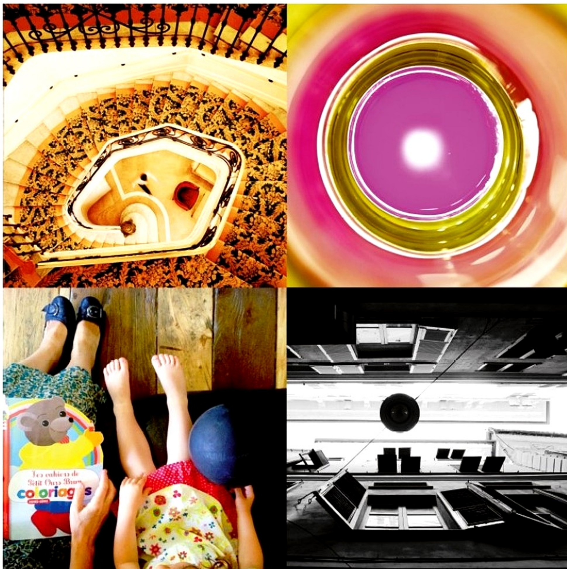
Vertige, vers le haut comme vers le bas ! Perdre son horizon... Le retrouver, rond ?!

Trèves de blabla, à vous les prises de vue vertigineuses ou cubistes !