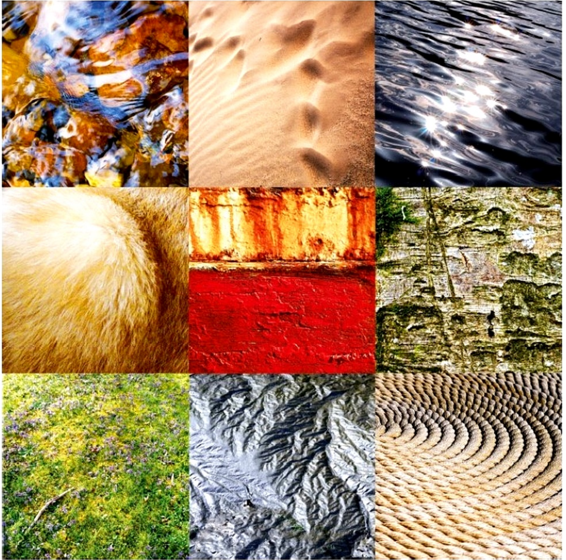
Un être vivant se cache au milieu de ces matières aqueuses, râpeuses, rouillées, courbées ! Textures variées.