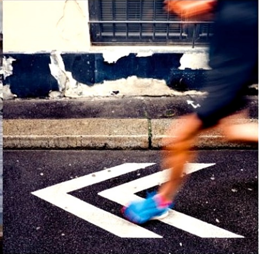
Flasher sur un décor. Composer ! Puis attendre... les passants, l'envol du goéland, le coureur matinal.