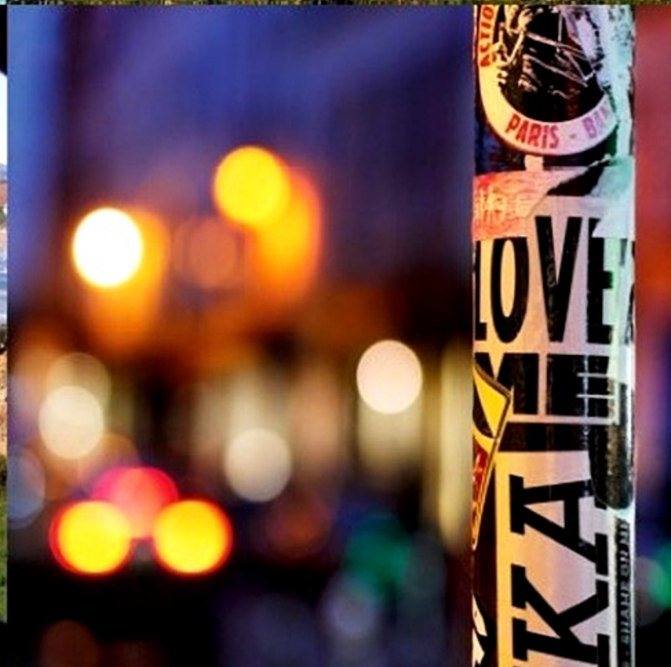
Arrière-plan pictural, graphique, bucolique, féérique ?! En ville, à la mer, au jardin, le décor le vaut bien !